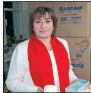
Vera asistentă medicală

Am adus aceste exemple pentru a demonstra și altora că din orice înfrângere trebuie să ieșim onorabil.