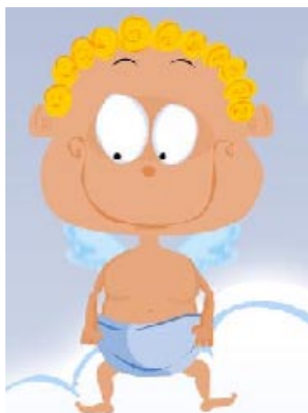
Ilustrație la filmulețul „Cupidon în acțiune”